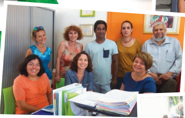
À gauche : L'équipe en 2016. Ci-dessous : Atelier Théâtre avec les locataires et leurs enfants en décembre 2019.